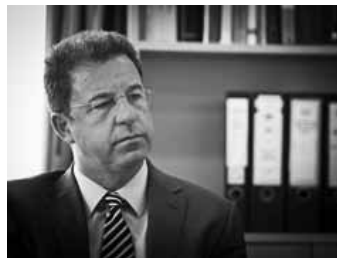
Tužilac Serge Brammertz