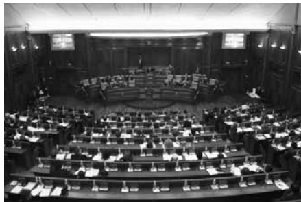
Kosovska skupština