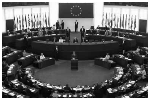
Parlament Evrope

!Evropski parlament: REKOM za pomirenje na Zapadnom Balkanu