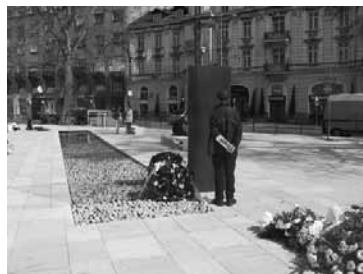
Novi beogradski spomenik